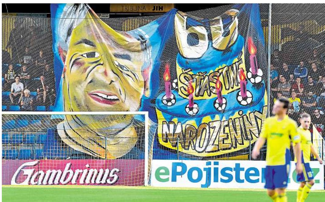
Oblíbený u fanoušků Zdeněk Červenka slavil v říjnu šedesátiny. V zápase s Jabloncem mu vděční fanoušci Zlína připravili choreo.