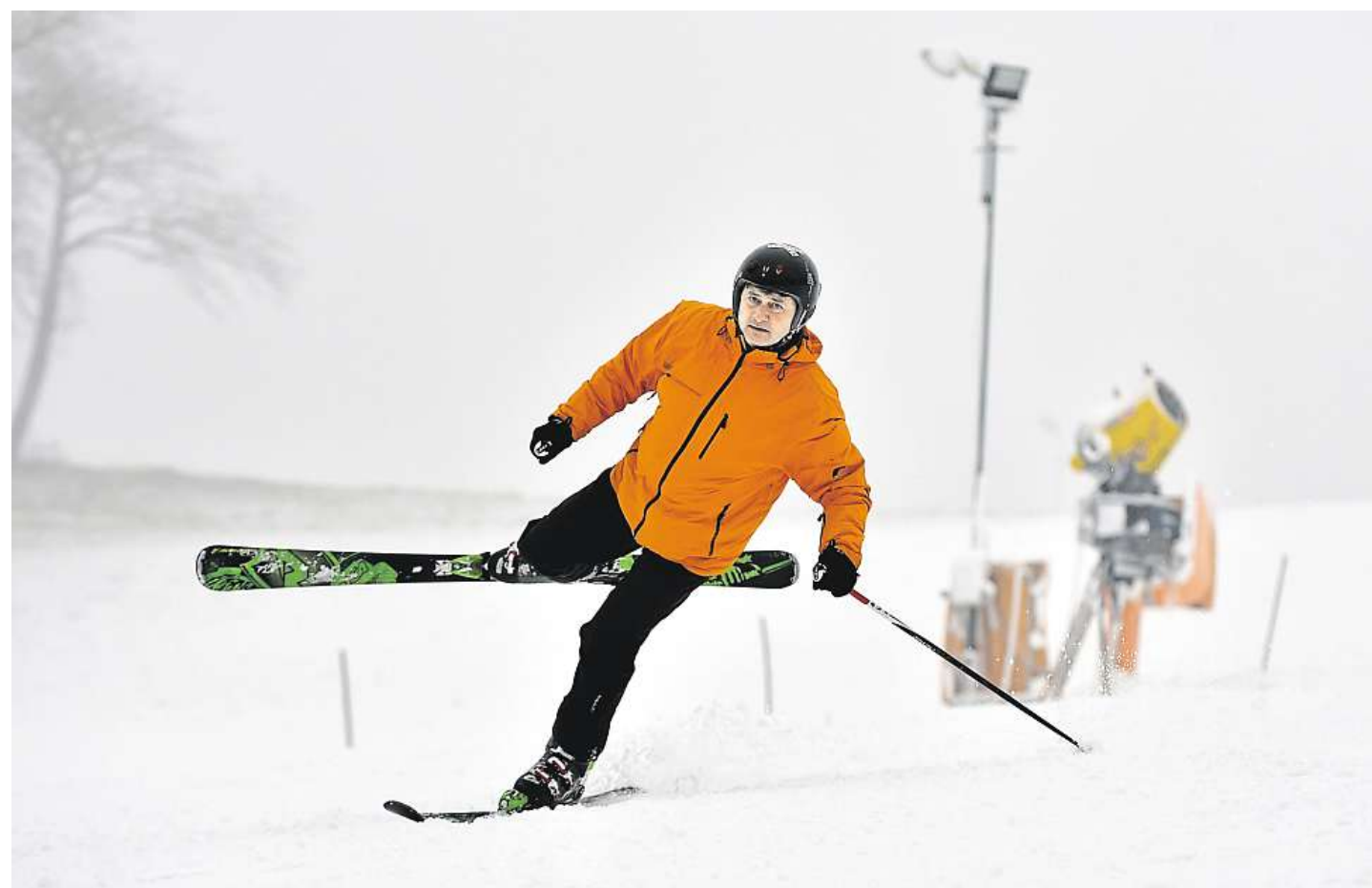
Lyžujeme Skiareál Stupava včera zahájil lyžařskou sezonu. Na svahu je v průměru šedesát centimetrů sněhu.

Lyžovat se začíná také ve Velkých Karlovicích. Jezdit se tu bude za mimosezonní ceny a k dispozici bude i lyžařská škola. Kromě sjezdovky